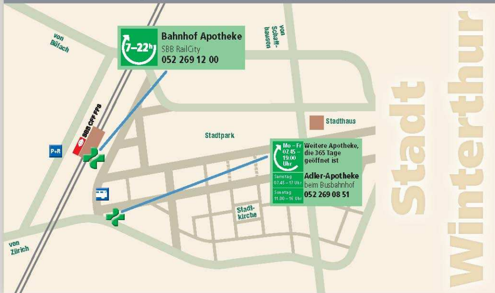
Bild2: Die Bahnhof Apotheke gewährleistet in der Stadt Winterthur die Versorgung mit Notfallmedikamenten während 365 Tagen im Jahr und ist über die kantonale Notfallnummer 0900 55 35 55 (Fr. 1.50/Min. ab Festnetz) rund um die Uhr erreichbar. Ebenfalls das ganze Jahr geöffnet hat die Adler Apotheke Winterthur.

24-Stunden Beratungs- und Notfallnummer 0900 55 35 55 (CHF 1.50/Min ab Festnetz)